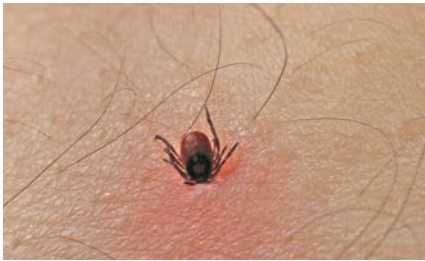
Teken bijten zich vast in de huid.

Teken zijn kleine beestjes. Ze zitten in het groen: vooral in het bos, de duinen, maar ook in het park en in de tuin. Teken zitten vaak in hoog gras en struiken. Teken kruipen op dieren of mensen en bijten zich vast om bloed op te zuigen. Teken bijten vooral in het voorjaar, de zomer en de herfst. Mensen die veel in de natuur zijn en kinderen die buiten spelen hebben vaker tekenbeten.